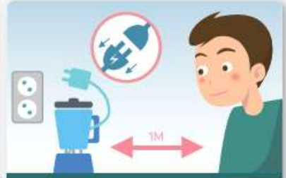
전기제품의 플러그를 빼고, 1m 이상 거리를 유지합니다.