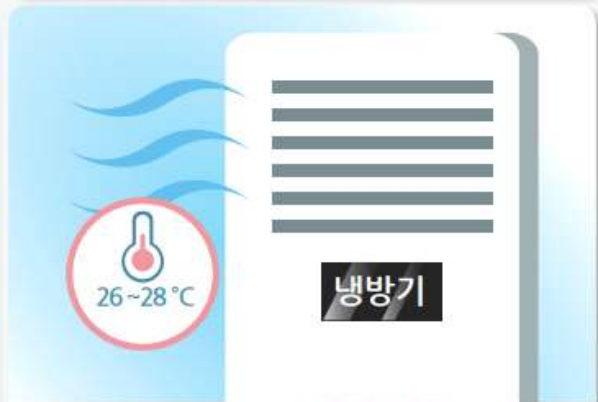
냉방기기 사용 시, 실내외 온도차를 5°C 내외로 유지하여 냉방병을 예방합니다. ※ 적정 실내 냉방온도 : 26~28°C