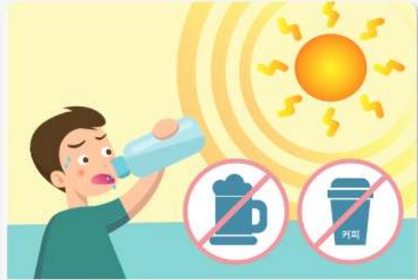
술이나 카페인 들어간 음료보다는, 물을 많이 마십니다.