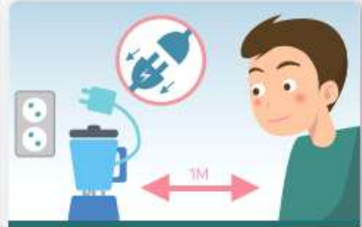
전기제품의 플러그를 빼고, 1m 이상 거리를 유지합니다.