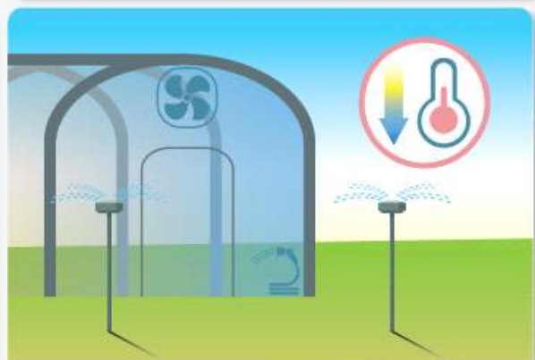
축사, 비닐하우스 등은 환기하거나 물을 뿌려 온도를 낮춥니다.