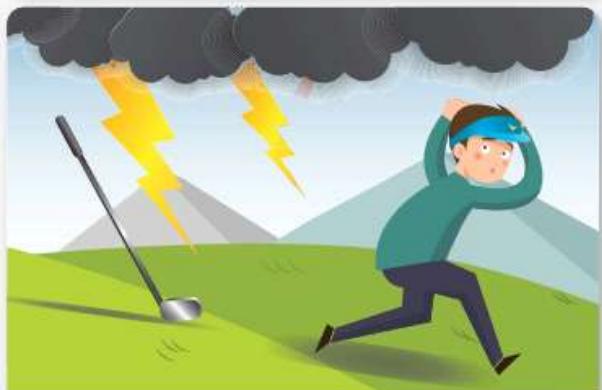
골프, 낚시 등 야외활동 중일때 장비를 몸에서 떨어뜨리고, 안전한 곳으로 대피합니다.