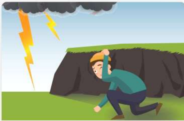
평지에서는 몸을 낮게하고 물기가 없는 움푹 파인 곳으로 대피합니다.