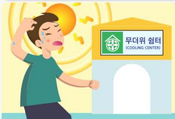
현기증, 메스꺼움, 두통의 가벼운 증세가 있으면 무더위 쉼터 등 시원한 장소를 이용합니다.