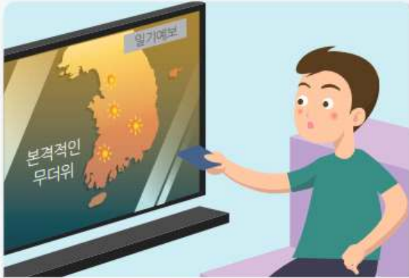
TV, 인터넷, 라디오 등을 통해 무더위 기상상황을 수시로 확인합니다.