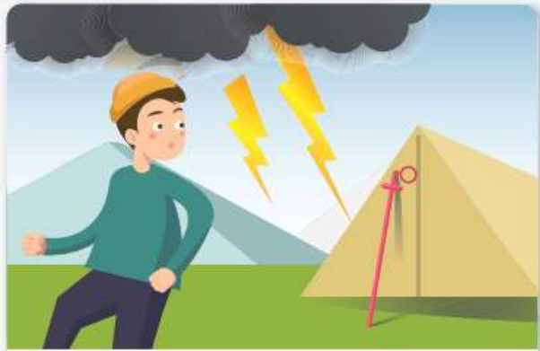
등산용 스틱이나 우산같이 긴 물건은 몸에서 멀리합니다.