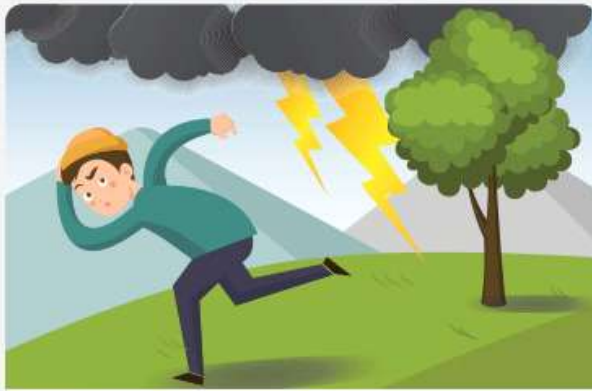
산 위 암벽이나 큰 나무 밑은 위험하므로, 낮은 자세로 안전한 곳으로 빨리 대피합니다.