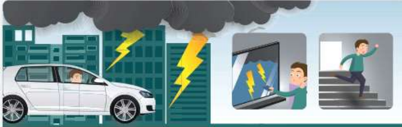
낙뢰 예보시 외출을 삼가고, 외부에 있을 땐 자동차 안, 건물안, 지하 등 안전한 곳으로 대피합니다.