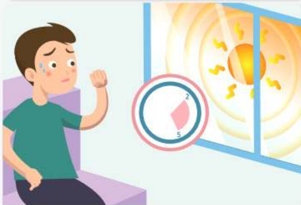
가장 더운 오후 2시~오후5시에는 야외활동이나 작업을 되도록 하지 않습니다.