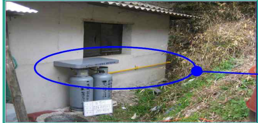
금속배관 및 용기차양 설치