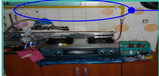
금속배관 및 퓨즈콕 설치