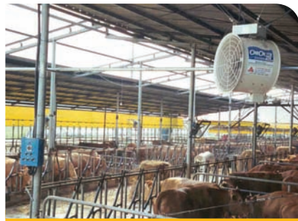
개량형 냉풍 장치