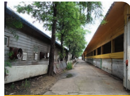
돈사주변 활엽수 식재