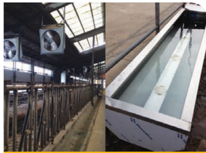
송풍기 온도조절 및 일반수조 사용