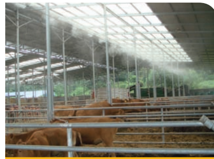
안개 분무 시설