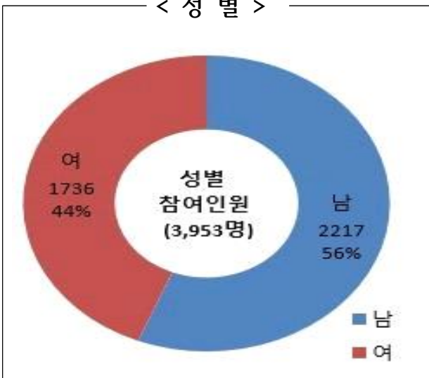
< 성 별 >