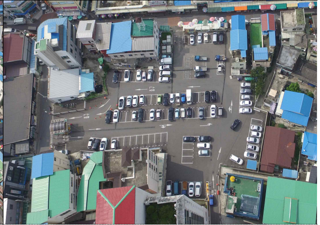
거창시장 주차장 전경