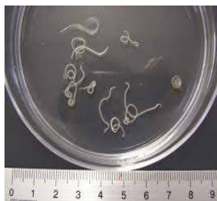
异尖线虫( Anisakis )幼虫图片