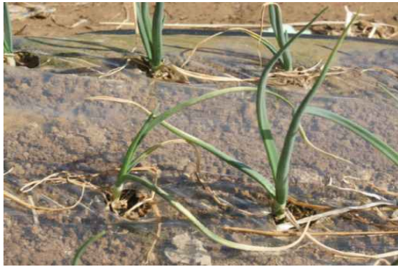
초기 노균병 증상(2~3월)