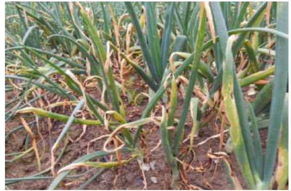
후기 노균병 증상(5월)