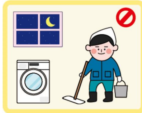
늦은 밤 세탁, 청소 자제