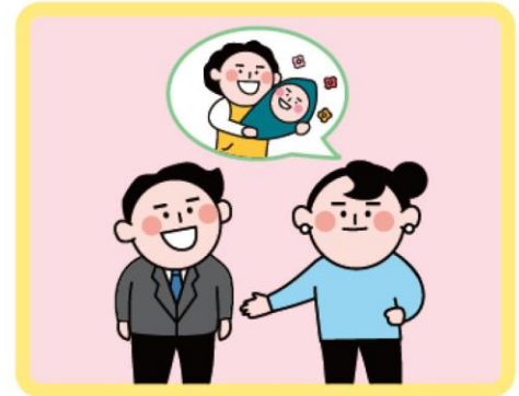
이웃간 사전 양해 구하기