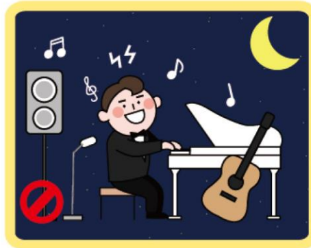
TV, 악기 소리 주의