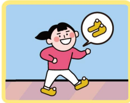
실내화, 매트 착용