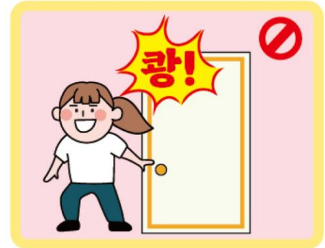
방문 닫는 소리 주의