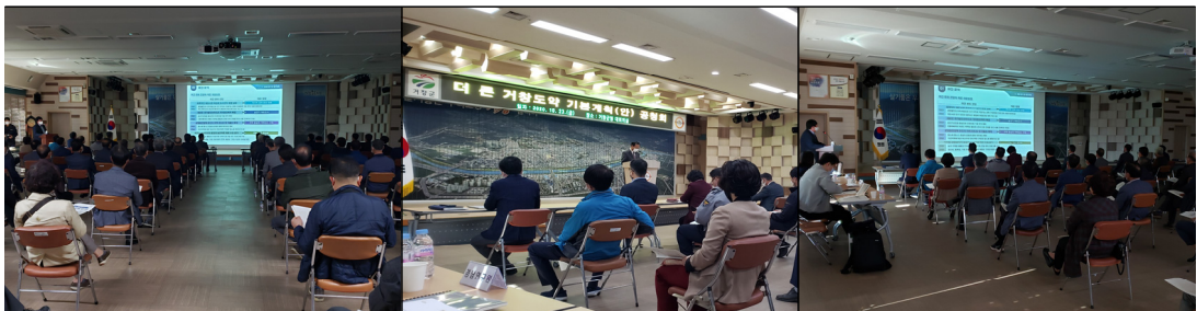
<그림 1-1> 공청회 개최